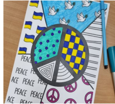
Kinderbilder geben den Menschen im Krieg Hoffnung