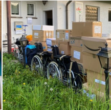
Sachspenden von vielen Bürgerinnen und Bürgern