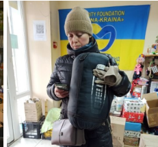
Sachspenden werden verteilt