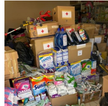
Sachspenden kommen in Pryluky an