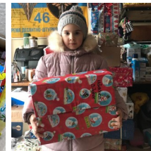
Sachspenden werden verteilt