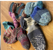
Sachspenden von vielen Bürgerinnen und Bürgern