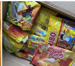
Sachspenden kommen in Pryluky an